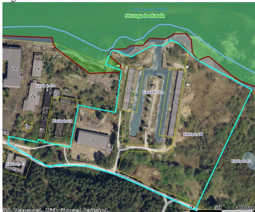
Joonis 1. Planeeringuga hõlmatud ala on piiritletud helesinisega joonega.

Narva-Jõesuu linnas asuva planeeringuala (joonis 1) suurus on ca 49,5 ha, mis moodustub kahest eraomandis ja kahest munitsipaalomandis olevat kinnistust ning reformimata riigimaast.