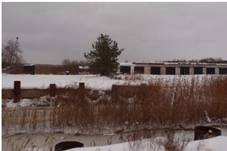
Foto 4. Vaade Kalda tn 32 põhjatipust kanalile. Üle kanali harude vahele jääva ala paistavad Kalda tn 36 põhjapoolsed paadigaraaži boksid. 11.11.2016.