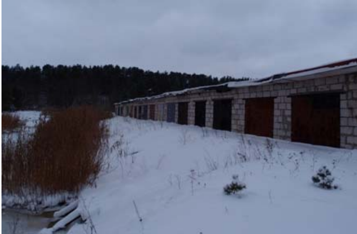
Foto 2. Vaade Kalda tn 32 põhjapoolsema paadigaraaži boksi eest paadi vettelaskmise rajatisele kanali ääres.

Paljude paadiomanike paatide garaaži boksid on Kalda tn 32 ja Kalda tn 36 eraomandis oleval kinnistul. Selleks, et paadikuure mitteomavad kalurid saaksid sildumiskoha lähialas oma paate ja osaliselt ka inventari paadikuurides hoida on kavandatud ehitada uusi paadikuure (lisa 4). Lisas 5 on planeeringu illustreerimiseks esitatud uute paadikuuride ja lähiala visualiseerimine.