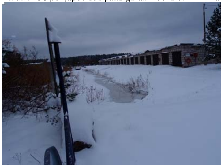
Foto 5. Vaade juurdepääsuteelt kanali idapoolsele harule ja Kalda tn 36 paadigaraaži boksidele.

Antud paadikanal on rajatud enne Eesti taasiseseisvumist, paadikooperatiiv „Viiking“ kasutas 1991. a seda kanalit. Pika aja jooksul on kanalisse settinud muda ja kasvanud pilliroogu ning teisi roht- ja puittaimi (fotod 2-5).