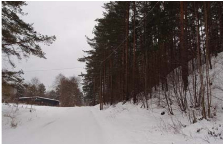
Foto 1. Vaade viilhallile ja Kalda täna äärsele planeeringust väljajäävale metsale.

Kalda tn 32a kinnistul paikneb paadisild (ehitisregistri kood 220316015). Kalda tn 38 kinnistu lõuna osas paikneb ladu-angaar (ehitisregistri kood 120683641), mis on ette nähtud kalurite kalapüügiriistade hoidmiseks (foto 1).