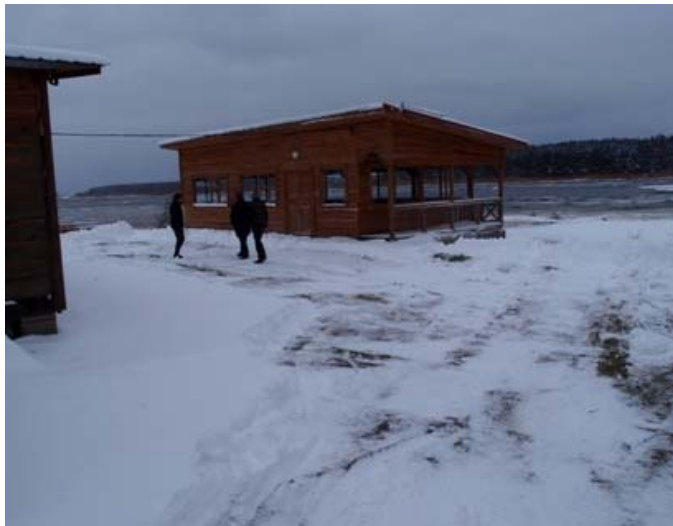
Foto 7. Vaade Kalda tn 32a loodetipus vanale vundamendile ehitatud hooajalisele välikohvikule.

Selleks, et Kalda tn 32a loodetipus vanale vundamendile ehitatud hooajaline välikohvik ja teised välikohvikuga seonduvad ehitised võiksid paikneda Narva jõe kaldale nõnda lähedal on vaja kindlasti vähendada kalda ehituskeeluvööndit. Käsitletud ka ptk 3. Ehituskeeluvööndi vähendamist tuleb kindlasti arutada ja käsitleda avalikustamisel ja KSH aruandes.