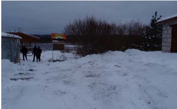
Foto 6. Vaade Kalda tn 32a loodetipus olevale hooajaliselt kasutatavale puhkealale. Fotol paremale jääb Kalda tn 32 paadigaraažide loodenuk. Fotodel 6 ja 7 on toodud Kalda tn 32a kinnisti loodeosas puhkeotstarbelises hooajalises kasutuses olevast alast ja selle seisundist.